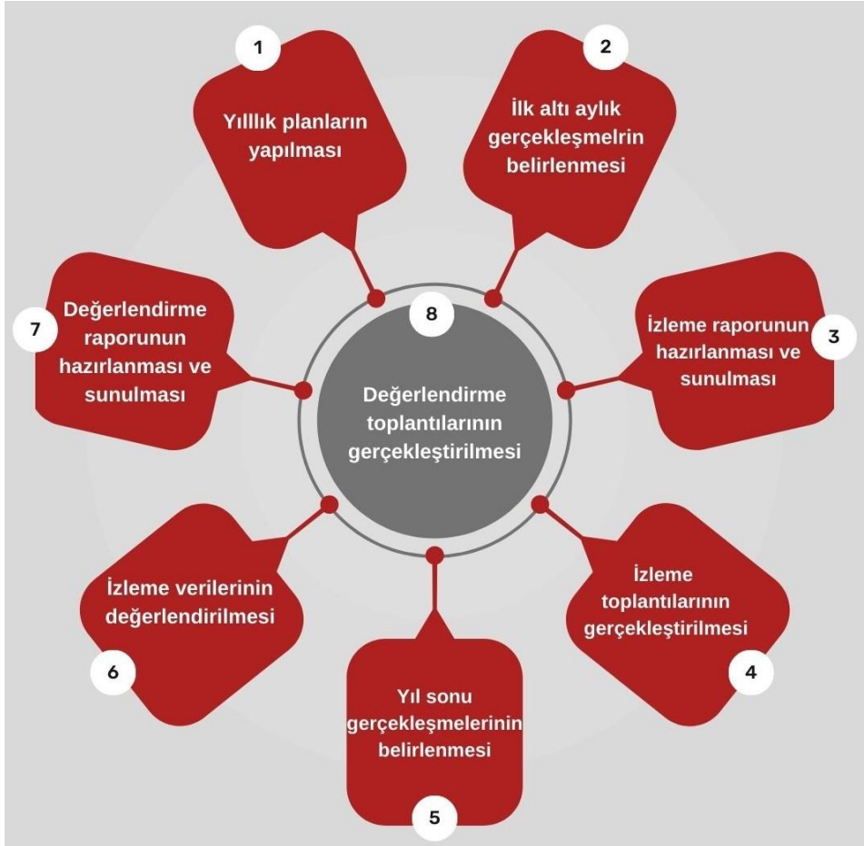
Şekil 1: İzleme ve Değerlendirme Süreci

İzleme ve değerlendirme sürecinin işleyişi ana hatları ile Şekil 1’te özetlenmiştir. 2024–2028 Stratejik Planı’nda yer alan performans göstergelerinin gerçekleşme durumlarının tespiti yılda iki kez yapılacaktır. Ara izleme olarak nitelendirilebilecek yılın ilk altı aylık dönemini kapsayan birinci izleme kapsamında, MEM Stratejik Plan İzleme ve Değerlendirme Modülü vasıtasıyla, harcama birimlerinden sorumlu oldukları performans göstergeleri ve stratejiler ile ilgili gerçekleşme durumlarına ilişkin veriler toplanarak konsolide edilecektir. Performans hedeflerinin gerçekleşme durumları hakkında hazırlanan “Stratejik Plan İzleme Raporu” Müdür, Müdür yardımcıları, birim amirleri ve kurum içi paydaşların görüşüne sunulacaktır. Bu aşamada amaç, varsa öncelikle yıllık hedefler olmak üzere, hedeflere ulaşılmasının önündeki engelleri ve riskleri belirlemek ve yıllık hedeflere ulaşılmasını sağlamak üzere gerekli görülebilecek tedbirlerin alınmasıdır. Yılın tamamına ilişkin ikinci izleme kapsamında ise MEM Stratejik Plan İzleme ve Değerlendirme Modülü vasıtasıyla, tarafından harcama birimlerinden sorumlu oldukları performans göstergeleri ve stratejiler ile ilgili yıl sonu gerçekleşme durumlarına ait veriler toplanarak konsolide edilecektir.